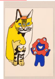
木下晃希 『ミyakumiyakuとネコ』 マット紙・ポスカ 290×200mm 2024年 税込27,500円