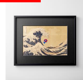
箔一 箔名画 北斎立体額 神奈川冲浪裏とミyakumiyaku 税込55,000円