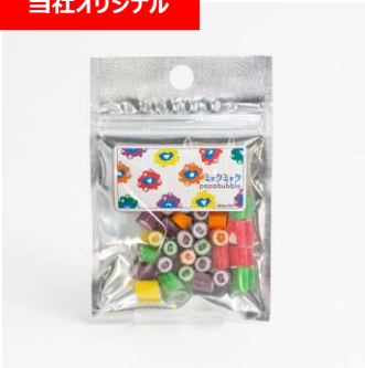
PAPABUBBLE キャンディ ミyakumiyakuフルーツミックス 税込1,058円