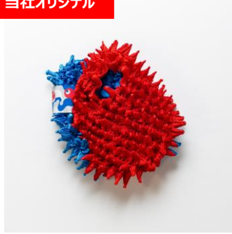
BUNZABURO プチバッグ バイカラー Inochi 税込7,700円