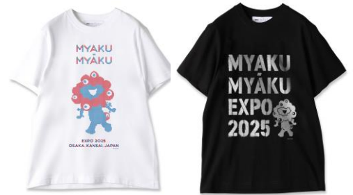
ミントデザインズ Tシャツ各種 各税込16,500円