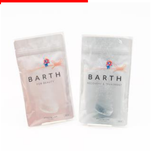
BARTH 左：中性重炭酸入浴料BEAUTY 9錠 税込1,500円 右：薬用中性重炭酸入浴剤 9錠 税込1,300円