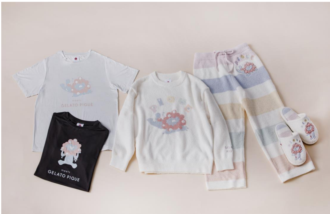
<ジェラートピケ> 大丸松坂屋百貨店 限定商品。開幕後、順次販売予定。

大丸松坂屋百貨店は、2025年4月13日(日)から10月13日(月)までの期間、大阪・関西万博の会場内オフィシャルストアにて、約200種類のオリジナル商品を展開いたします。当社は、サステナビリティ経営の重要な柱である「Think LOCAL」(店舗を構える地域の魅力発信)活動を通じて、地域の魅力を積極的に発信しています。大阪・関西にゆかりのあるアーティストとコラボレーションしたアート作品、日本人デザイナーズブランドと手がけるアパレルや雑貨、そして職人の技が光る日本の伝統工芸品など、多彩なカテゴリーの商品を取り揃えました。これらを通じて、大阪・関西、ひいては日本の文化と魅力を世界へ発信してまいります。